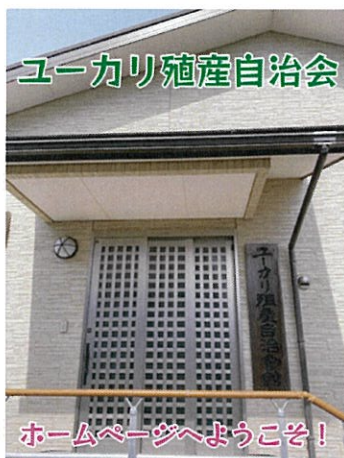
ユーカリ殖産自治会の新着情報