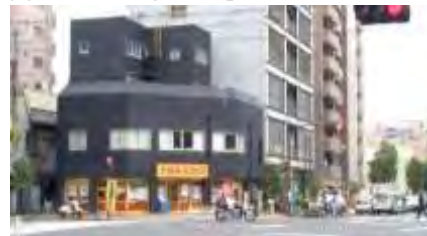
本所三笠町（亀沢4丁目12付近）

江戸時代の都市伝説今回は「足洗い屋敷」をご紹介します。大横川の遊歩道のレリーフには次のように書いてあります。「本所三笠町に住む旗本屋敷に、夜ごと家鳴りがし、天井からひどくよごれた大足がニョッキリでる。足を洗ってやるとおとなしく引込める。たまりかねた主人は同僚と屋敷を交換したところ、足は現れなくなったという。」ネットには次のようなことが書いてあります。「そのまま足を洗わずにいると夜が明けるまで屋敷中を暴れ回ったという事です。」