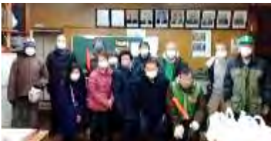
↑初日に参加した皆さん

年末恒例の歳末警戒パトロールを12月26日から30日までの午後8時から行いました。5日間の延べ参加人数は76名で去年より11名多い参加者がありました。寒い中、多くの方々の協力をいただき無事にパトロールを終了することができました。ありがとうございました。 ↓子供会の皆さん