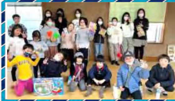
1月8日午前は書き初め 午後はお楽しみ会(子供会)

ですが内容を更新していますので最近の中身を一度覗いてみてください。③「立三掲示板」から「立三かわら版」にネーミングを変えて毎月発行を目指しています。皆様取材の協力をお願いしに行くこともありますがその時はご協力をお願いいたします。④ワイハイ(インターネット回線)を導入しました。携帯電話でネット通信などが会館内では無料で行えます。パソコンも導入しデータ保存にも力を入れています。町会員の皆様にはより一層のご理解と協力を賜りながら役員一同邁進させていくことを年頭のご挨拶とさせていただきます。