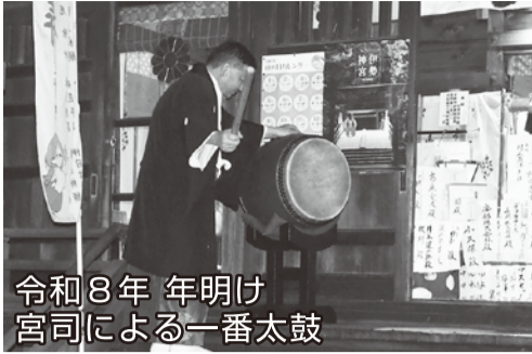
令和8年 年明け 宮司による一番太鼓