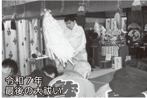
令和7年 最後の太鼓