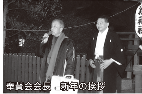
奉賛会会長、新年の挨拶