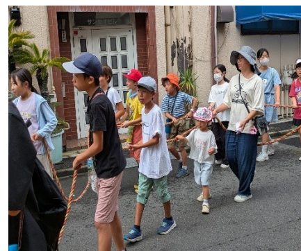
こどもたちの山車巡行