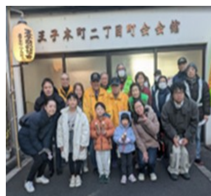
こどもナイトパトロール