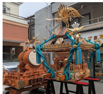
修繕された神輿と山車