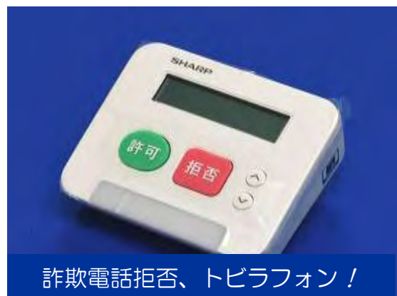
詐欺電話拒否、トビラフォン！

「トビラフォン」は詐欺電話と思われる電話の着信を自動的に拒否してくれます。「自動通