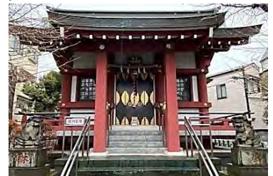
▲中原八幡神社の拝殿と狛犬

一口メモ ◆中原八幡神社は江戸時代初期(1527年)に旧中原村開村に際し、禍から村を守る鎮守様として創建されたと言われています。