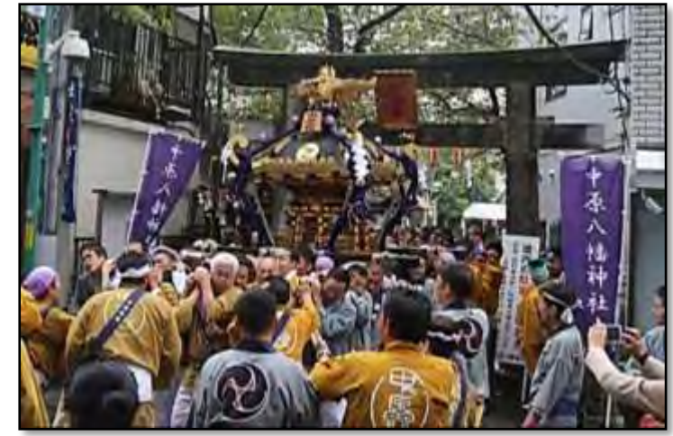
▲前回 2015 年度の例大祭！

今年度は3年に一度の中原八幡神社例大祭の年です。日程は平成30年9月29日(土)・30日(日)の2日間。中原町会・中原八幡神社・中原睦会の主催運営にて執り行われます。