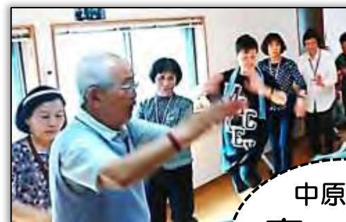
毎週木曜、盆踊りで健康維持!(女性部)

2015 年の例大祭(写真)後、傷みが激しかった神輿は修理に出されて復活。4/23 お披露目されました。