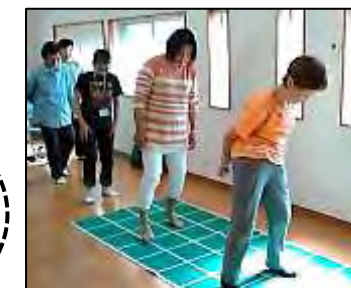
『ずっと元気であるための講座』脳トレ(厚生部)