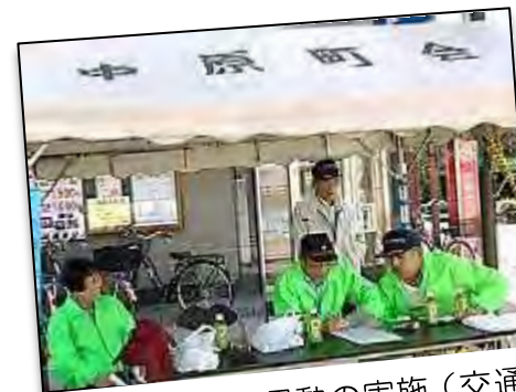
春の交通安全運動の実施(交通部)