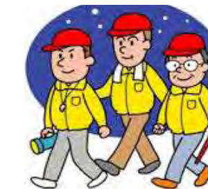
昼：下校時安全パトロール(女性) 夜：防犯パトロール(男性)