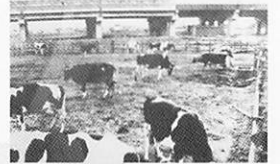
葛西駅近くにあった牧場と開通後の東西線

鉄道・バスの開通や新駅開業で、駅前やまちはどのように発展してきたの? 江戸川区の明治時代～現在までを写真やイラストで紹介するよ!