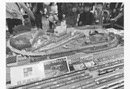
岩倉高等学校の鉄道ジオラマ

鉄道博物館所蔵の駅名プレートや、地下鉄博物館所蔵の東西線の車両模型(1/25サイズ)、岩倉高等学校鉄道模型部製作の超精密ジオラマが見学できるよ!(ジオラマは模型車両の走行日あり)