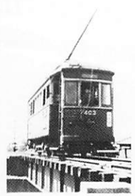
城東電車

人々に愛された城東電車やトrolleyバス、区内各路線の開通や車両の進化などを紹介するよ!