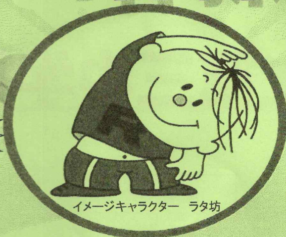
イメージキャラクター ラタ坊

ラジオ体操のカードを 持っている人はカードを 忘れないでね! 会場でスタンプを 押します!!