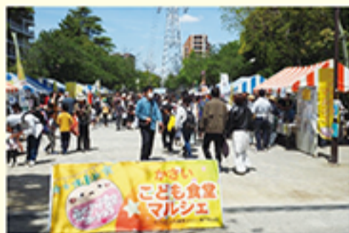
開催場所: 滝野公園

フード販売やワークショップ、制服体験やお仕事体験ができるブースがあるなど、みんなでおいしく楽しい時間を過ごすことができました!