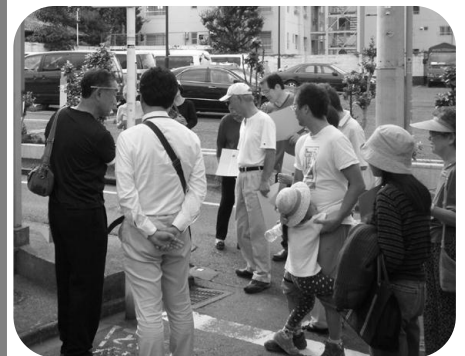
第6回まちづくり検討準備会での まち歩きの様子