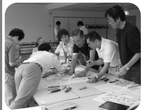
まち歩きで発見した課題を 地図上に指摘している様子