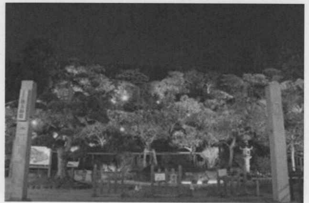
ライトアップの様子

駐車場・有料 (梅の見頃の時期は一部制限がありますので池上梅園にお尋ねください。 また、大変混雑しますのでなるべく公共交通機関をご利用ください。)