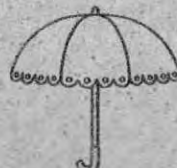
ハンディファン 日傘