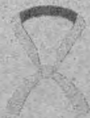
アイス枕 クールネック