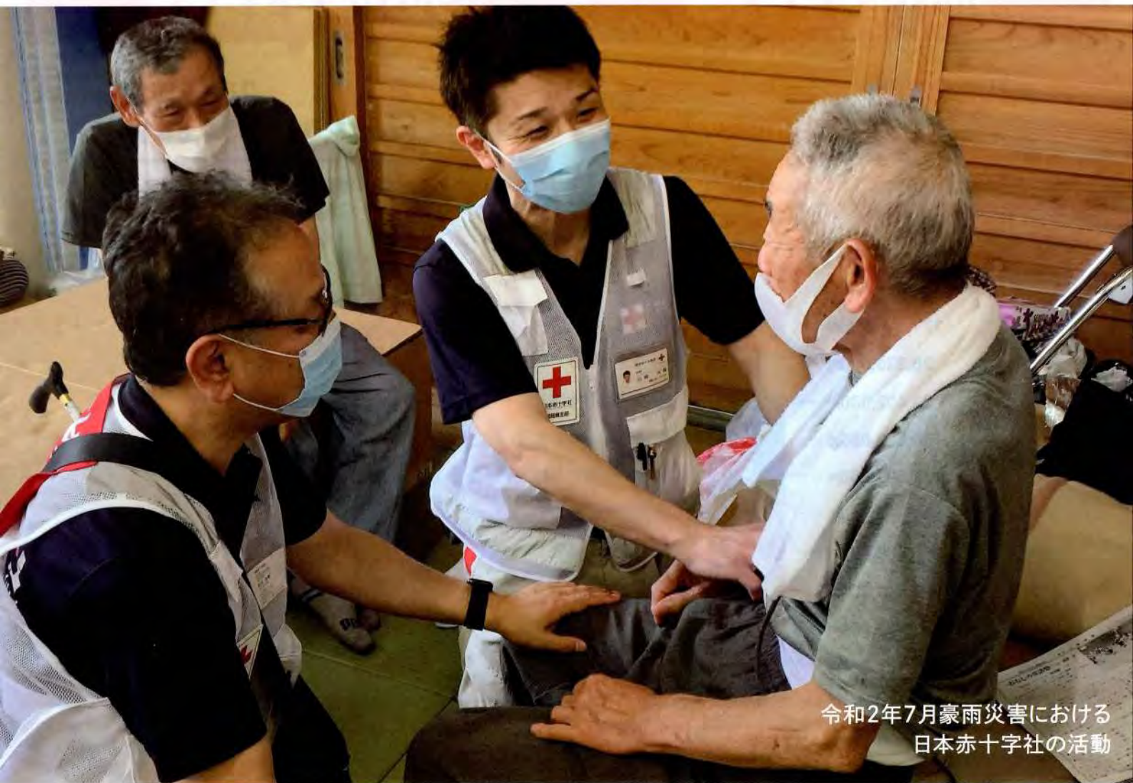
令和2年7月豪雨災害における 日本赤十字社の活動