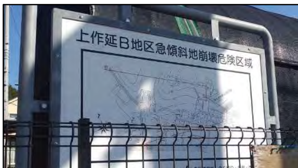
急傾斜地崩壊危険区域の標示の例