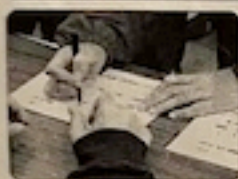
避難者台帳の作成