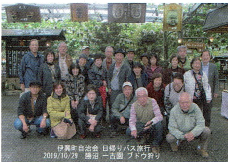
伊興町自治会 日帰りバス旅行 2019/10/29 勝沼 一古園 フドウ狩り