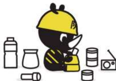
東京防災公式キャラクター 「防サイくん」

東京にはさまざまな災害リスクが潜んでいます。いつもの暮らしに少しだけ手を加える、小さな備えの積み重ねが、多くの命を守ります。今からできる準備を進めましょう。