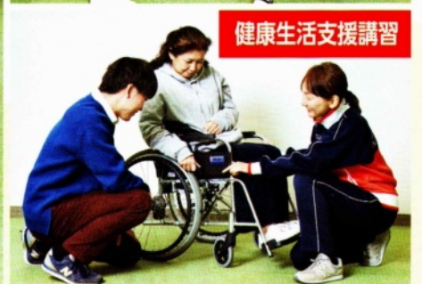
健康生活支援講習