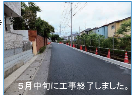
5月中旬に工事終了しました。

この工事により、雨水の取り込み能力が向上し、大雨時の水害軽減が期待できます。また設置済みの排水ポンプも同様に設置しダブルで万全を期すそうです。上尾市下水道施設課によりますと、雨水の行先は、尾山台都市下水道を通り綾瀬川に放水されるそうです。