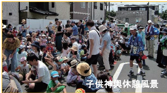
子供神輿休憩風景