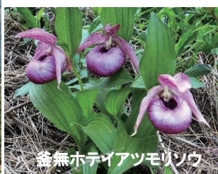
昔無ホテイアツモリソウ