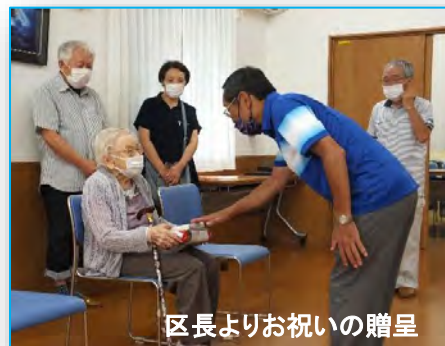
区長よりお祝いの贈呈