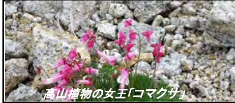
高山植物の女王「コマクサ」