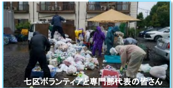
七区ボランティアと専門部代表の皆さん

回収後、分別作業をしています。 アルミ缶(潰して)とスチール缶 を分けて出して下さい。 ご協力お願いします 😊