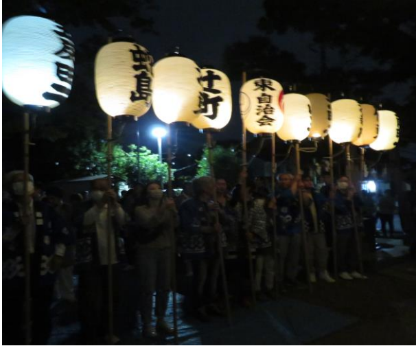
各町会の高張提灯