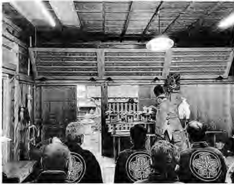
2021年の「二の午祭」神事

諏訪神社「二の午祭」神事 日にち 令和5年2月17日(金) 時間 神事11時から