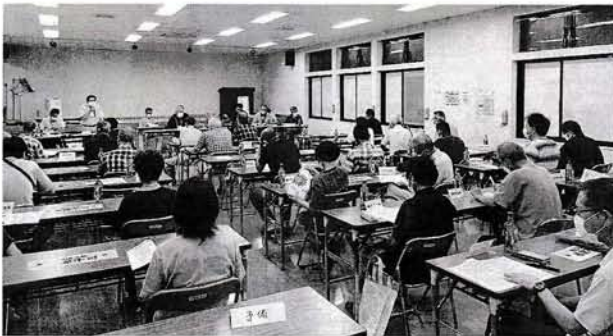
町民の融和と協調を図り、親睦を深め、故郷づくりの和を広げ、先人の歴史と感謝の心を表し集うことを目的とする。なおコロナ禍にある為、感染防止対策を講じたうえで、規模の縮小・時間短縮・飲酒禁止でコンパクトに実施する。