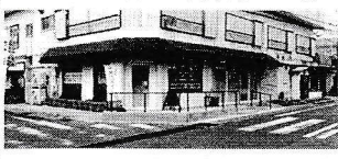
エンジ色の看板が目印です

地域の介護を必要とする方、介護をしている方、 お子様や学生の方まで誰もが参加し集える場所 です。色々と語り合うことで交流を深めましょう。