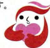
犯罪被害者等支援シンボルマーク 「ギョuttoちゃん」