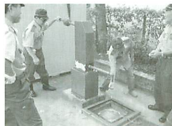
③防災井戸の動作確認