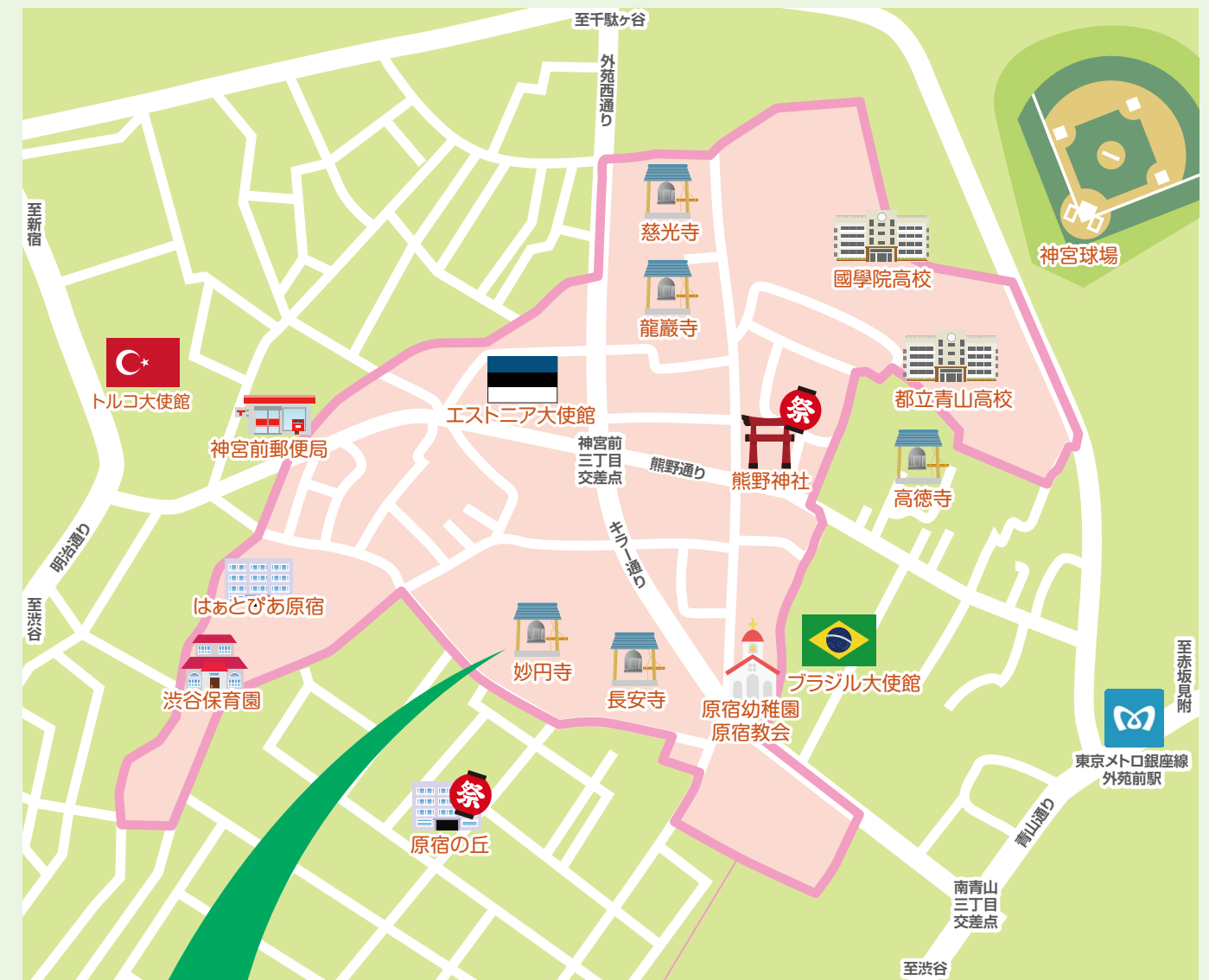
Open Street Map and contributors 地図は CC BY-SA としてライセンス